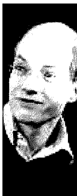
A fianco Alain de Botton A sinistra un'immagine di Illustrators